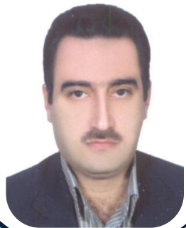
پژوهشگر برتر دکتر سید محمود حسینی